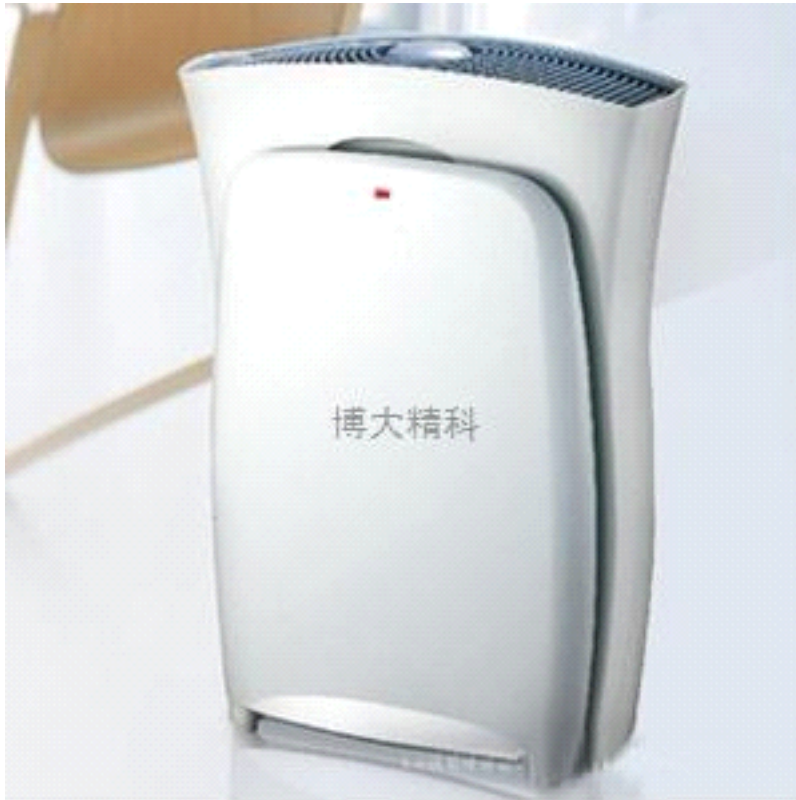
3M FAP03 超洁净空气净化器